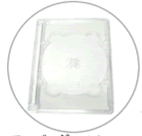
スーパージュエル トルケース(クリアー)