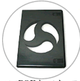
エコBOX トールケース (ブラック)