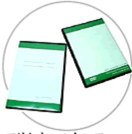
スリムトルケース (ブラック)